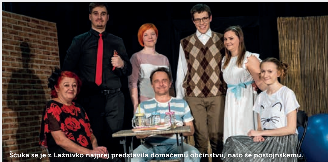
Ščuka se je z Lažnivko najprej predstavila domačemu občinstvu, nato še postojnskemu.