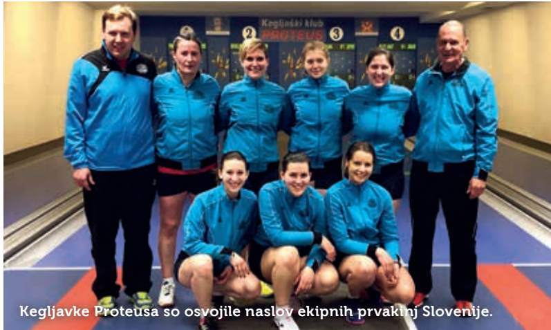
Kegljavke Proteusa so osvojile naslov ekipnih prvakinj Slovenije.