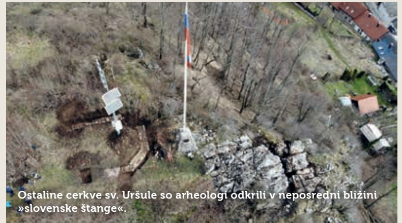
Ostaline cerkve sv. Uršule so arheologi odkrili v neposredni bližini »slovenske štange«.