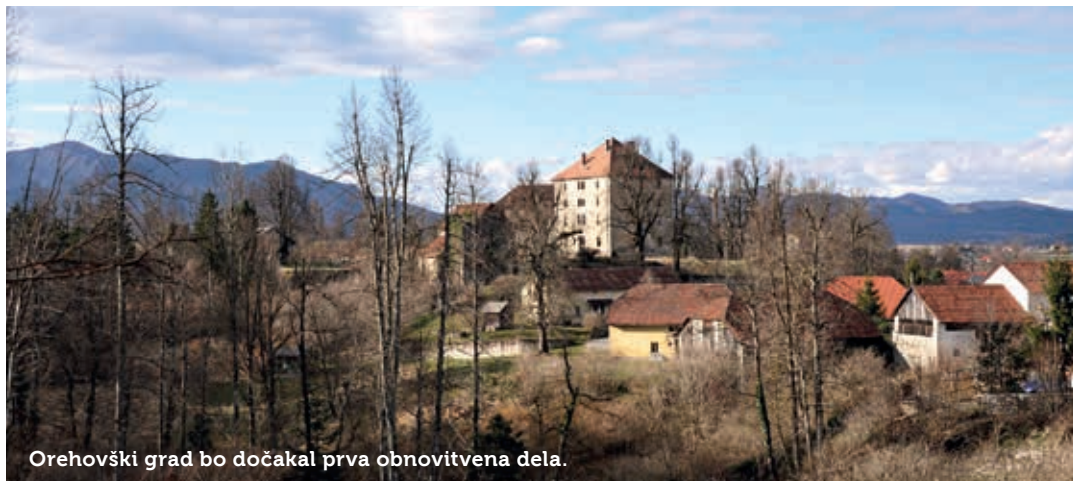
Orehovski grad bo dočakal prva obnovitvena dela.

Zapleti z Zavodom za spomeniško varstvo in zaradi nestrinjanja dela vaščanov za umestitev mrliške vežice v stavbo starega »farovža« so botrovali novogradnji ob pokopališču pri cerkvi sv. Lovrenca. Ličen objekt je sestavljen iz treh delov; na vežico se navezujeta njegov nadstrešek in tlakovana brežina za dostop. Obenem so asfaltirali še parkirni prostor ter uredili dostop do obnovljenega vaškega vodnjaka Pri luži in napaalnega korita. Na bližnjem vojaškem bunkerju so postavili nova vrata in očistili okolico. Obnovljena je bila še »štima« na šolskem dvorišču. Na stavbi kulturnega doma so zamenjali tri dotrajana okna in vhodna vrata ter na novo pobarvali njeno notranjost. V okviru projekta Čista Ljubljana so se ob pomoči Občine in s pridobljenimi evropskimi sredstvi veselili celotne prenove črpalnišča vode in stavbe v Korotanu. Poljske poti, ki jih ni malo, skušajo urediti sproti.