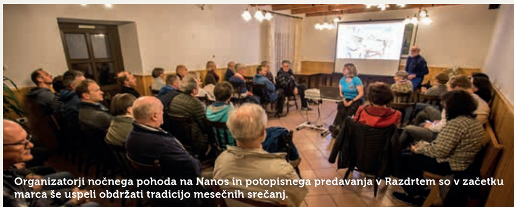
Organizatorji nočnega pohoda na Nanos in potopisnega predavanja v Razdrtem so v začetku marca še uspeli obdržati tradicijo mesečnih srečanj.

Besedilo: Marino Samsa; fotografija: Tomaž Penko.