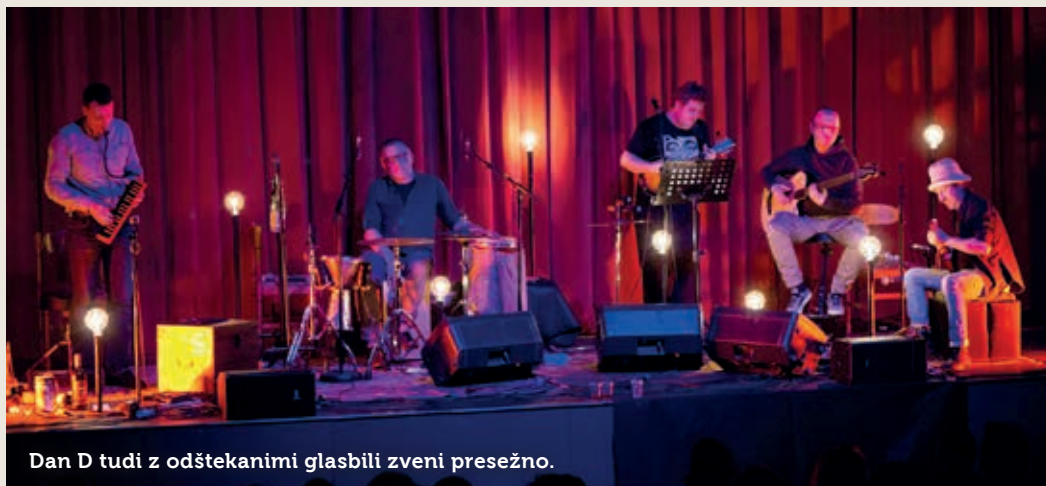
Dan D tudi z odštekanimi glasbili zveni presežno.

V oktobru in novembru 2012 so na turneji Tiho izvedli sedemnajst klubskih koncertov po različnih koncih Slovenije. Spomnim se izjemnega vzdušja na njihovem koncertu v Hiši kulture v Šmartnem v Goriških Brdih. Zagotovo smo vsi ljubitelji glasbe dandevcev mnenja, da je bil ta projekt eden njihovih glasbenih presežkov. Poseben pa je bil tudi zaradi vezi, ki so jih na intimno zasnovanih koncertih ustvarjali z občinstvom. "Turneja Tiho nas je ponovno zblížala, ločnica med nami in vami se je zabrisala," so takrat zapisali na svoji spletni strani. V letu 2012 so Po-