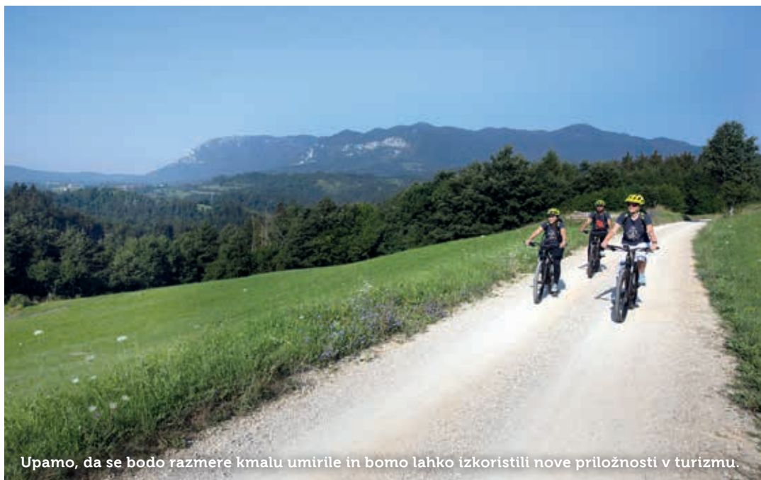
Upamo, da se bodo razmere kmalu umirile in bomo lahko izkoristili nove priložnosti v turizmu.

V ta namen bosta Slovenska turistična organizacija (STO) in turistično gospodarstvo okrepila promocijo na bližnjih trgih, kajti predvidevajo, da bodo letos tako imenovani »potniki na dolge razdalje« hitro preusmerili poletne počitnice na destinacije v sredo-