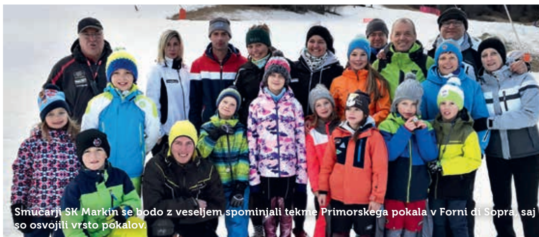
Smučarji SK Markin se bodo z veseljem spominjali tekme Primorskega pokala v Forni di Sopra, saj so osvojili vrsto pokalov.

Za povzetek sezone in rezultate v skupnih seštevkih bo čas kasneje, saj so moči zdaj usmerjene na druga področja. Skupne rezultate razglasijo običajno na srečanjih tekmovalcev, trenerjev in staršev iz vseh klubov posameznega sklopa