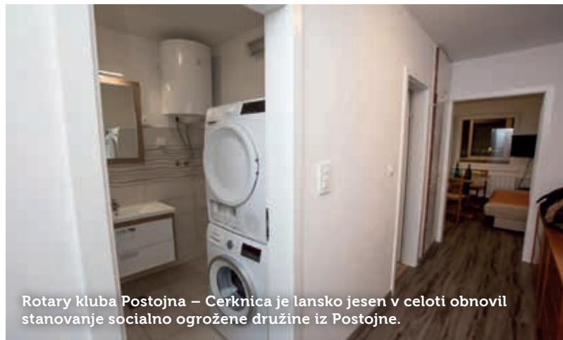
Rotary kluba Postojna – Cerknica je lansko jesen v celoti obnovil stanovanje socialno ogrožene družine iz Postojne.

Rotary klub Postojna - Cerknica je v svojem štiriletnem delovanju organiziral več predavanj in okroglih miz ter na ta način spodbujal širšo družbeno skupnost k razpravam o aktualnih in perečih družbenih vprašanjih in ozaveščal javnost v regiji. Pri tem mu pomagata tudi