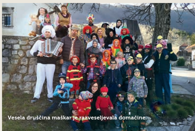
Vesela družina maškar je razveseljevala domačine.

Izkupiček pustovanja bodo namenili, tako kot vsako leto, za skupen izlet. VRŽ