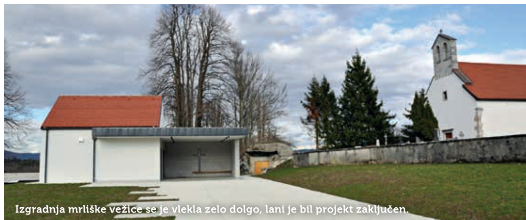
Izgradnja mrliške vežice se je vlekla zelo dolgo, lani je bil projekt zaključen.

Lansko leto so uspešno zaključili desetletje dolg projekt izgradnje novega poslovnega objekta.