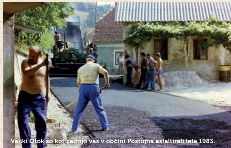
Veliki Otok so kot zadnjo vas v občini Postojna asfaltirali leta 1983.