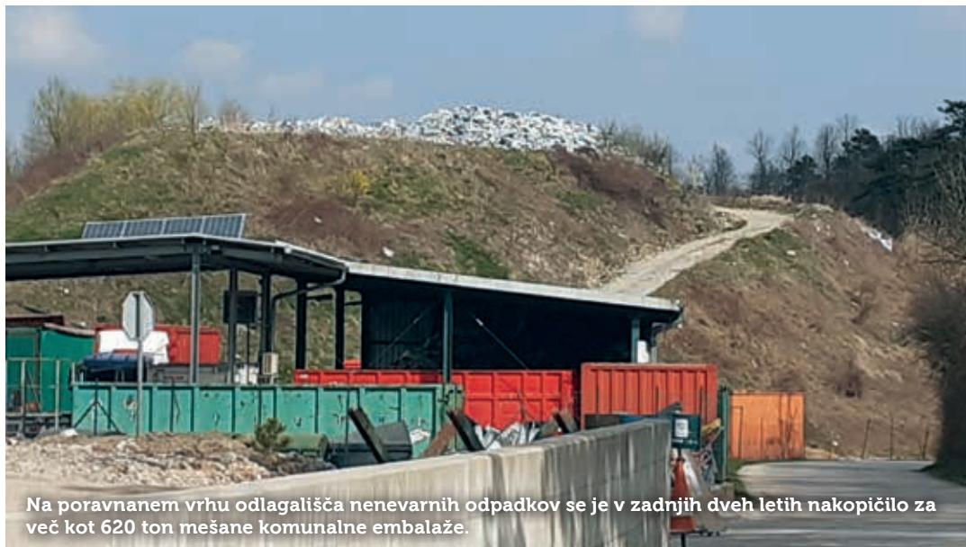
Na poravnem vrhu odlagališča nenevarnih odpadkov se je v zadnjih dveh letih nakopičilo za več kot 620 ton mešane komunalne embalaže.

Na Občini in v Publikusu so računali, da bo Ministrstvo za okolje in prostor (MOP) pridobilo z interventnim zakonom prevzemnika embalaže,