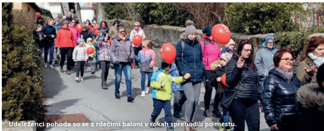
Udeleženci pohoda so se z rdečimi baloni v rokah sprehodili po mestu.